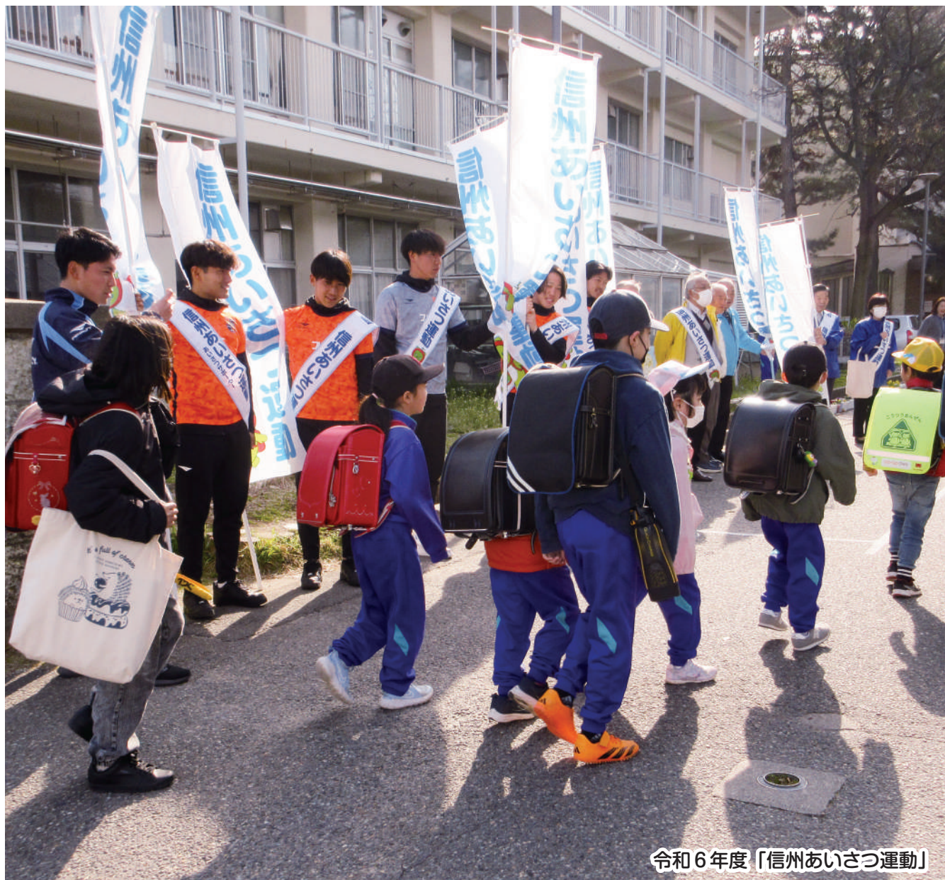
令和6年度「信州あいさつ運動」