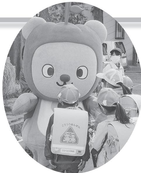
アルクマも活動に参加し 子どもを応援しています

信州らしくさわやかで温かみのあるあいさつ運動になるよう願いを込めて「信州あいさつ運動」と命名されました。